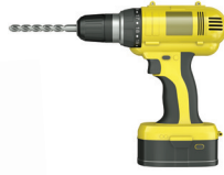
使用2英寸 (5厘米)的钻头钻孔