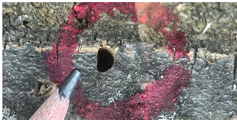
Orificio de emergencia en forma de D