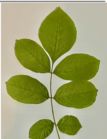
Hoja de fresno de Oregon

Hojas compuestas con 5-11 folíolos Ramificación opuesta no escalonada Patrón de corteza en forma de diamante Las semillas son sámaras en forma de remo