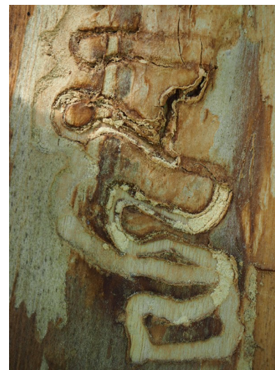
Galerías en forma de S