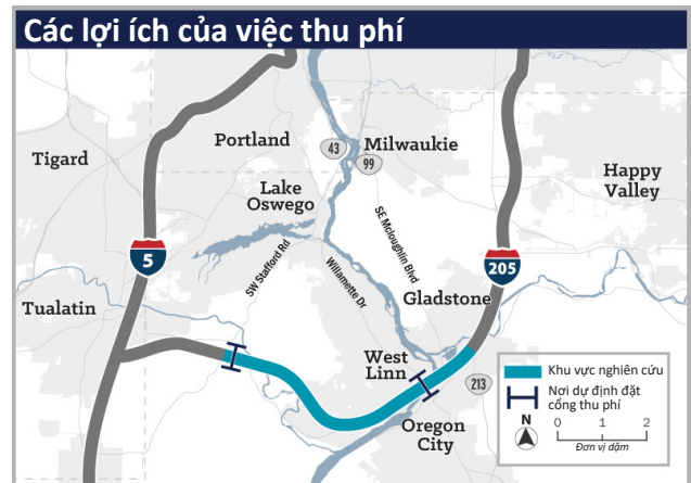
Theo phương án được đề xuất, nơi thu phí sẽ ở cầu Abernethy và Cầu Tualatin River.

Các khoản đầu tư sẽ đóng góp vào cải thiện sự công bằng